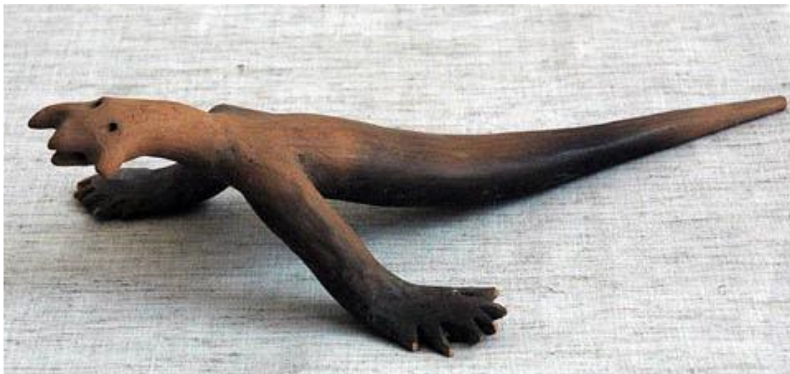
Шестипалый из Акамбаро.

Реальности не только ветвятся, но и склеиваются. Классические миры альтерверса (соотнесенные состояния) могут взаимодействовать друг с другом. Когда такой процесс становится возможным, образуются особые состояния КРФМ, называемые склейками.