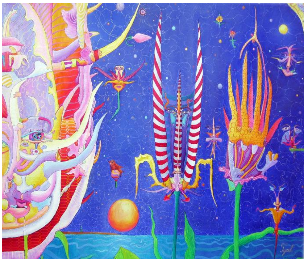
Картина Б.Гусева «Андалузский кот»