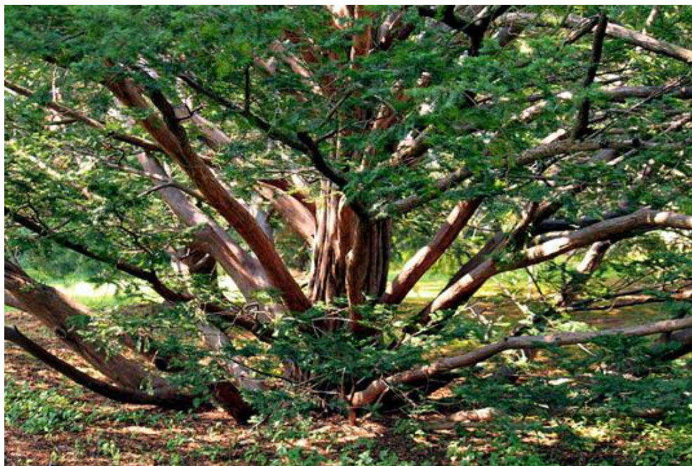
Лиственница в Принстонском Университете.

Реально все возможное. Реальности КРФМ – результат взаимодействия наблюдателя и объекта. В процессе взаимодействия наблюдателя и объекта реализуются (т.е. буквально – делаются физически реальными) все возможные их взаимные состояния (соотнесенные состояния). Такой процесс называется эвереттическим ветвлением.